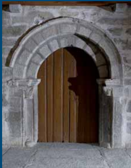
Villanueva de Valrojo