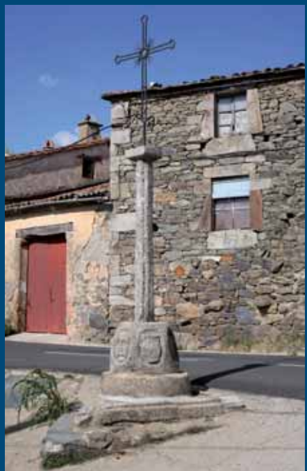
Crucero de Figueruela de Arriba