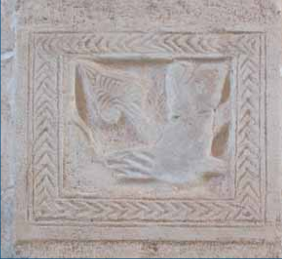
Placa mármol iglesia de Rabanales