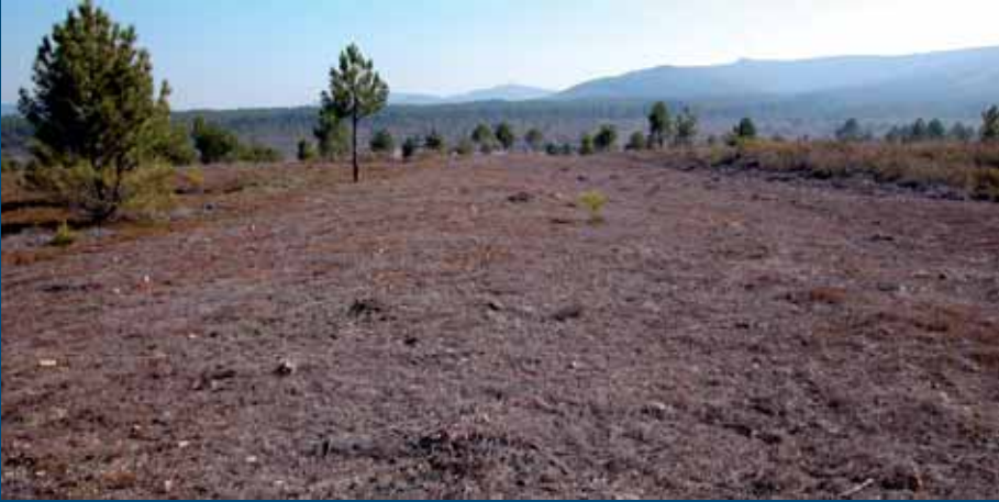
Agger perfectamente conservado en Las Llatas, en el tramo entre Figueruela de Arriba y San Pedro de las Herrerías