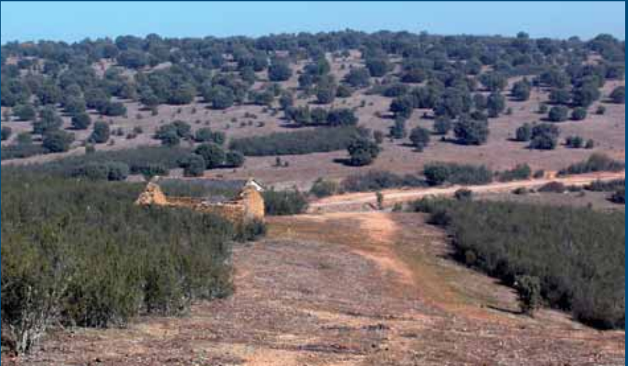
Tramo de la Via Augusta entre Puerto Calzado y Moldones