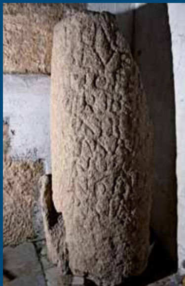
Miliario original romano en Gallegos del Campo