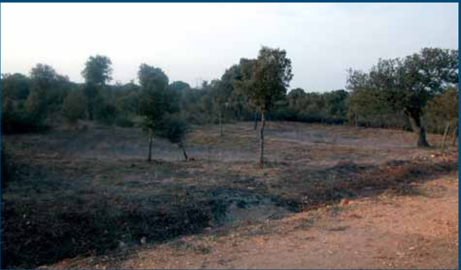
Antiguas pozas de extracción de grava para pavimentar la calzada entre Otero de Bodas y Olleros de Tera