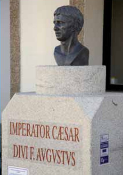
Busto de Cesar Augusto en Rabanales