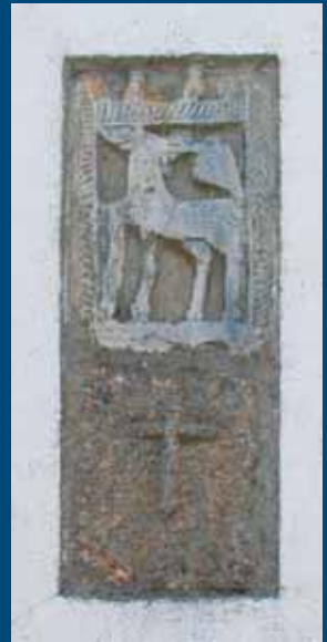
Placa mármol iglesia de Rabanales