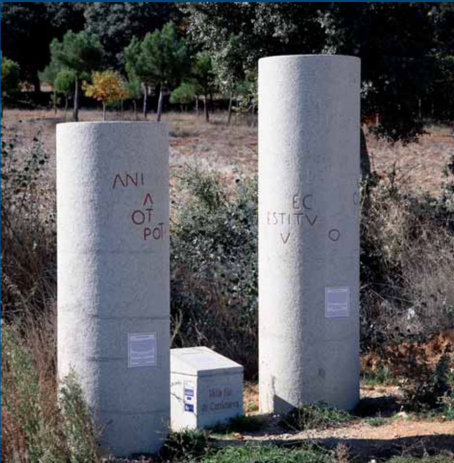
Miliarios situados en el sitio denominado Carricueva entre Fuente encalada y la demarcación con León