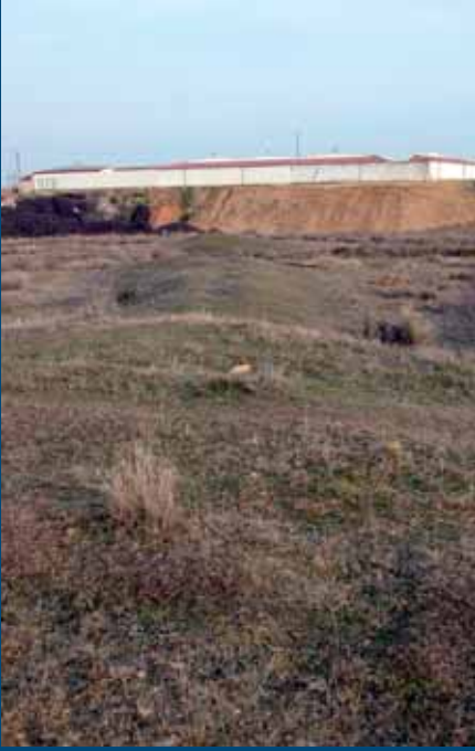
Restos de la calzada en Olleros de Tera