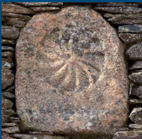
Estela romana en una de las casas de Rabanales