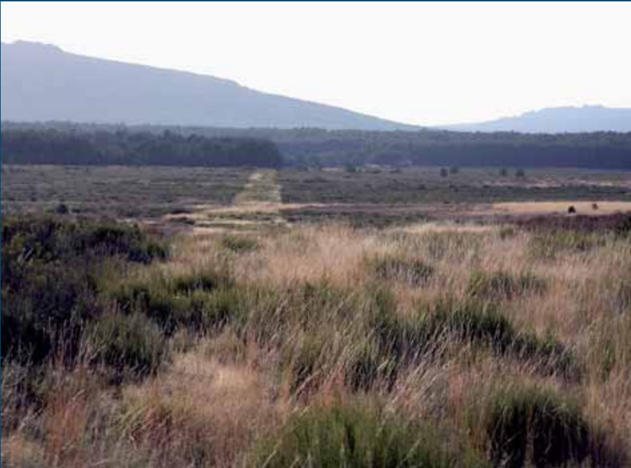
Tramo de la vía romana XVII que discurre por el término de Villardeciervos