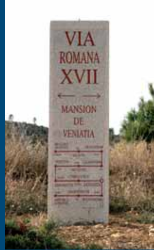
Miliario Mansión de Veniata