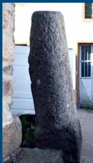
Miliario original romano en San Vitero