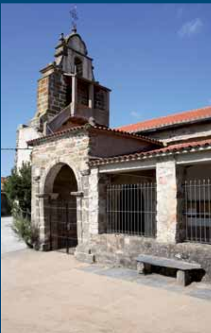
Iglesia de Figueruela de Abajo