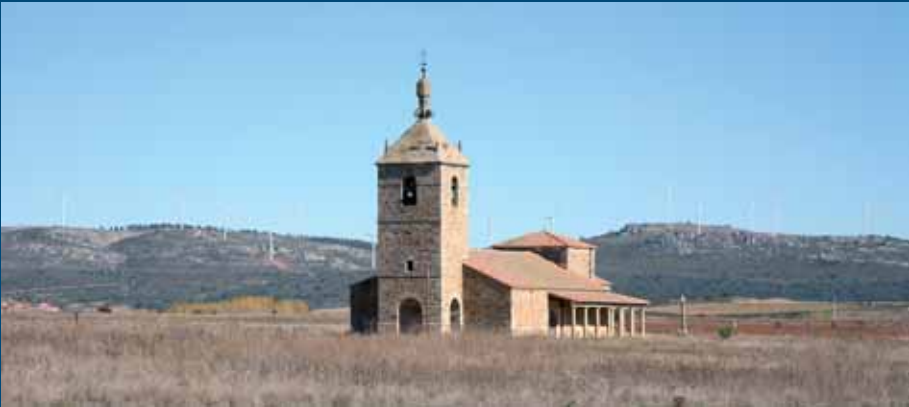
Ermite de Nuestra Señora del Campo, pasado Petavonium y en el cruce con la carretera de Rosinos de Vidriales