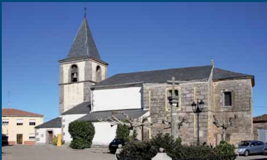
Iglesia de Rabanales