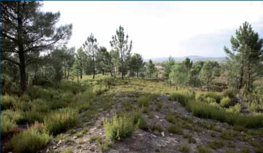
Agger en la Chana de Valdetallas, en el tramo entre Boya y Villardeciervos