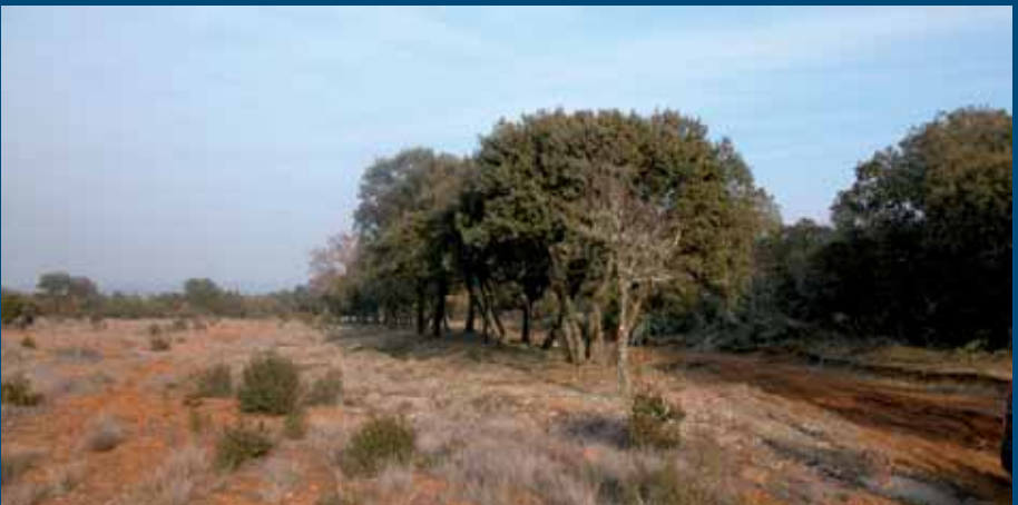
Tramo de calzada entre Calzada de Tera y San Juanico El Nuevo