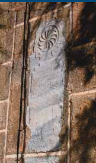
Estela funeraria iglesia de Rabanales