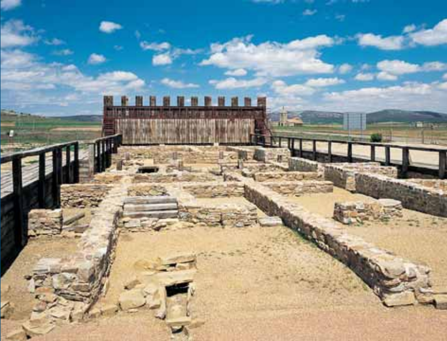
Campamento romano de Petavonium, en la carretera de Santibáñez de Vidriales a Fuente Encalada