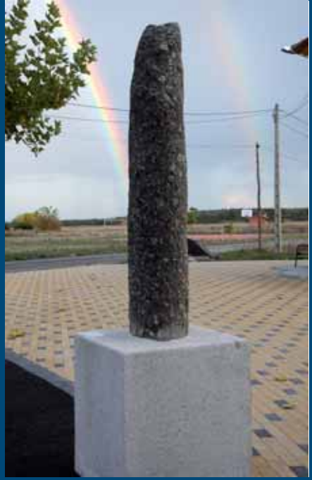
Miliario original romano en Calzadilla de Tera