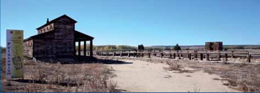
Campamento romano de Petavonium, en la carretera de Santibáñez de Vidriales a Fuente Encalada